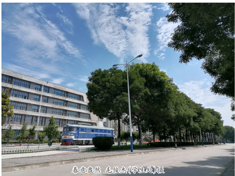
春意盎然