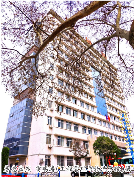
春意盎然