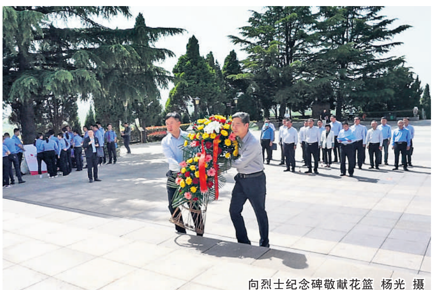
向烈士纪念碑敬献花篮