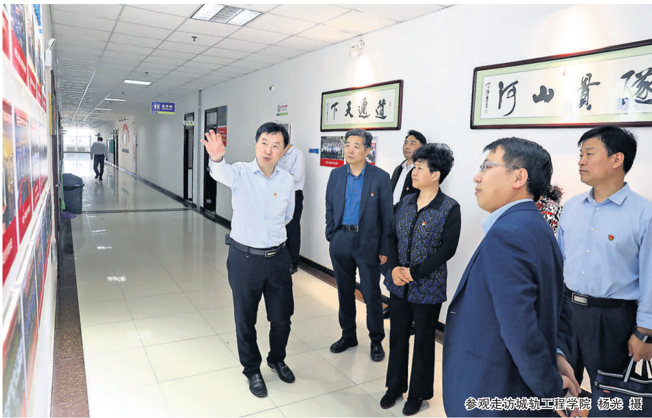
参观走访城轨工程学院

据悉,技能大师工作室建设项目是国家高技能人才振兴计划的子项目,于2011年启动实施,由中央财政给予专项支持。