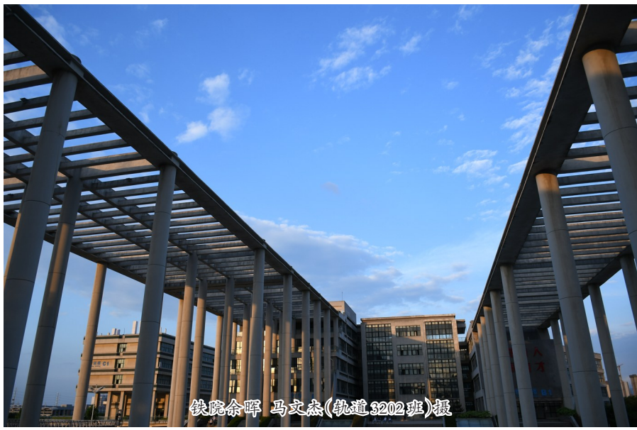
铁院余晖