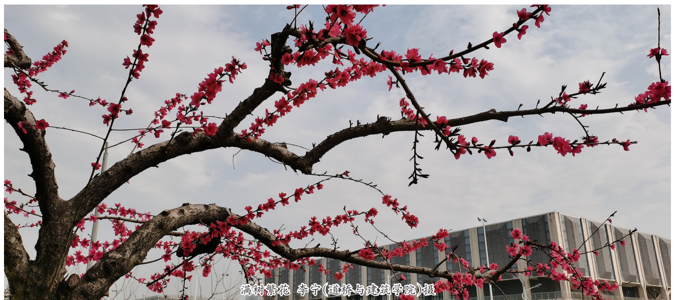
满树繁花