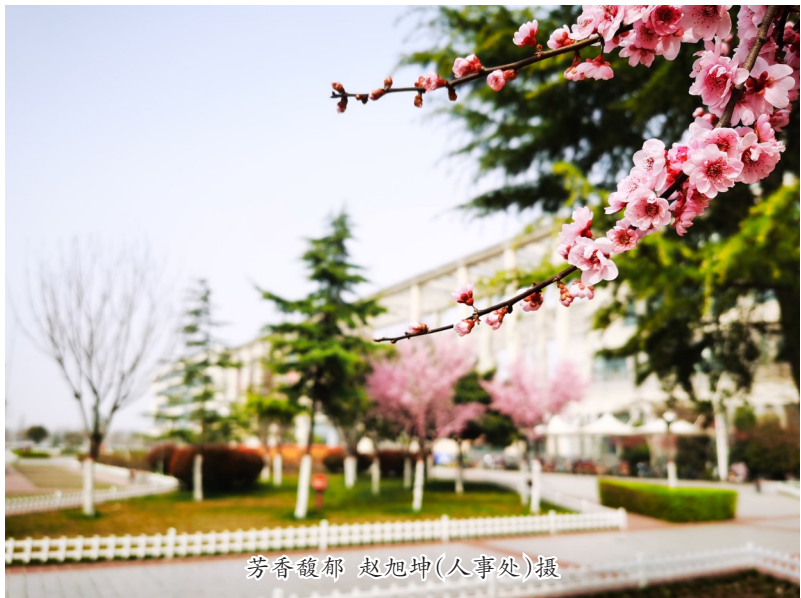
芳香馥郁