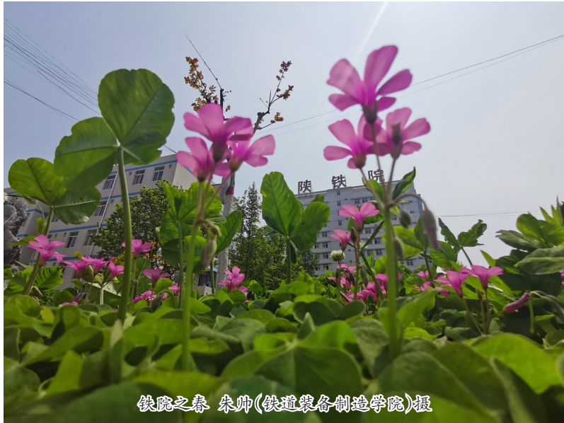
铁院之春