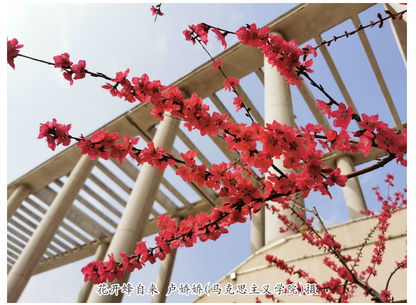
花开蜂自来