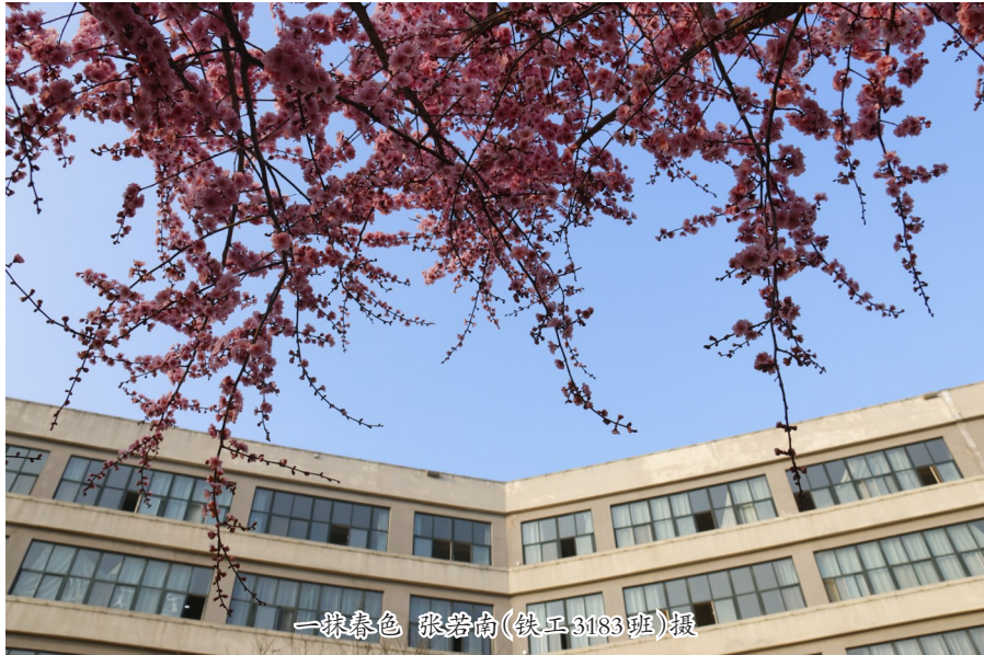
一抹春色