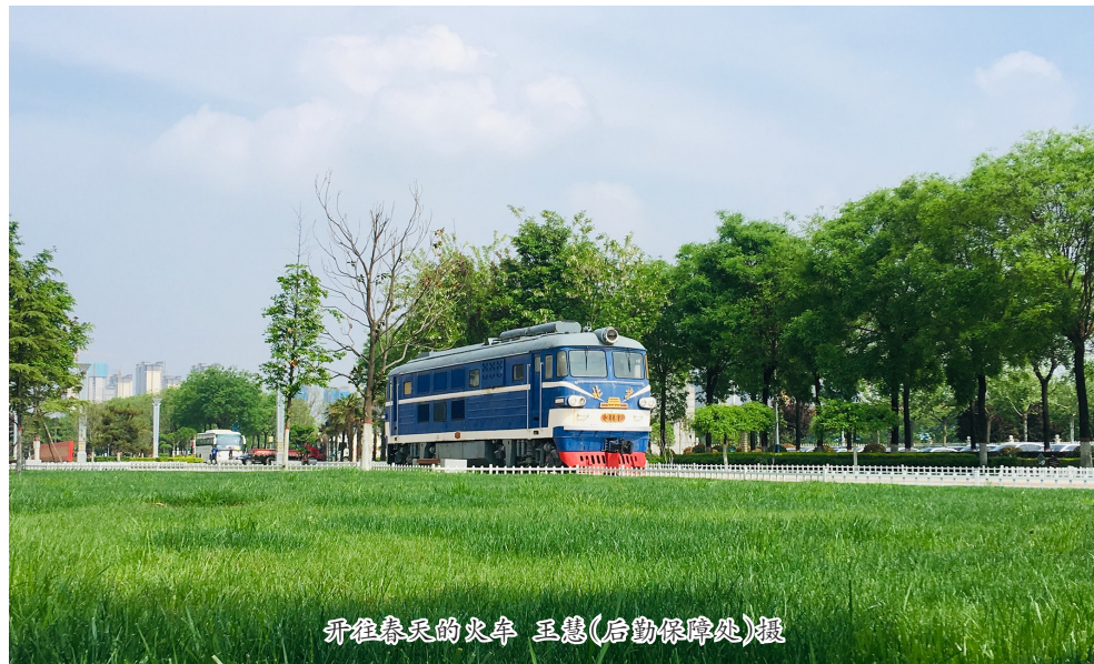
春暖花开的火车