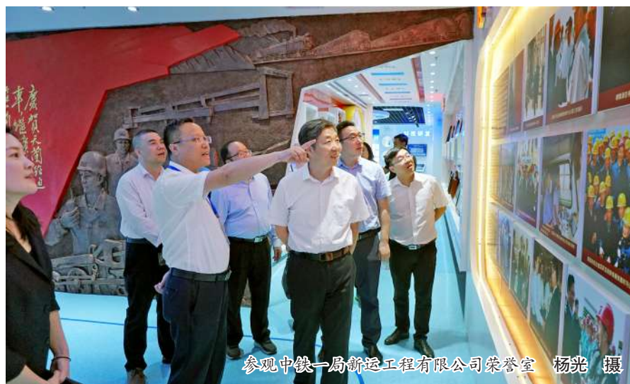
参观中铁一局新运工程有限公司荣誉室

本报讯(通讯员 田庆)为深化校企合作,推动产教融合,5月18日,校长焦胜军、副校长祝和意,相关院部负责人一行11人组成调研组,赴中铁一局集团第四工程有限公司、中铁一局集团新运工程有限公司进行考察、调研。