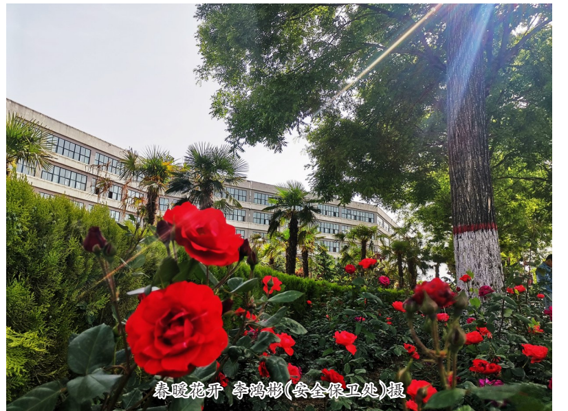
春暖花开