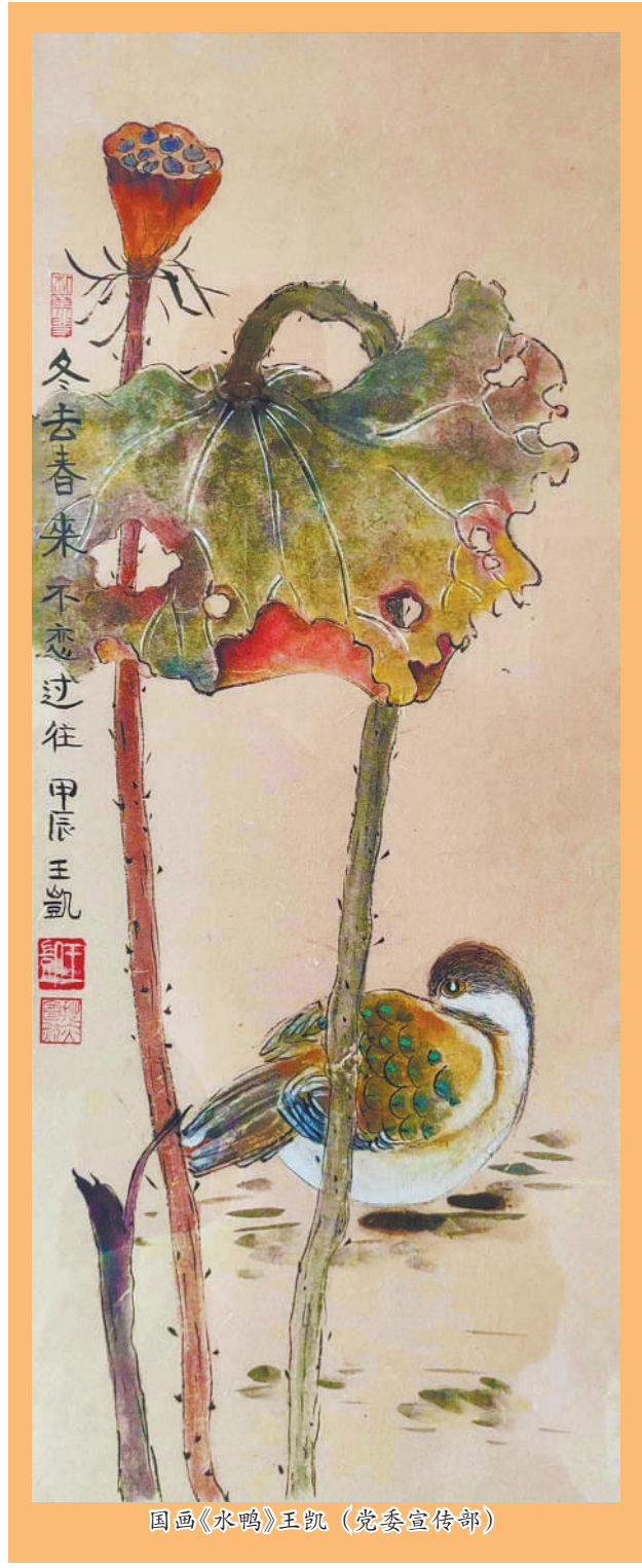
国画《水鸭》王凯 (党委宣传部)