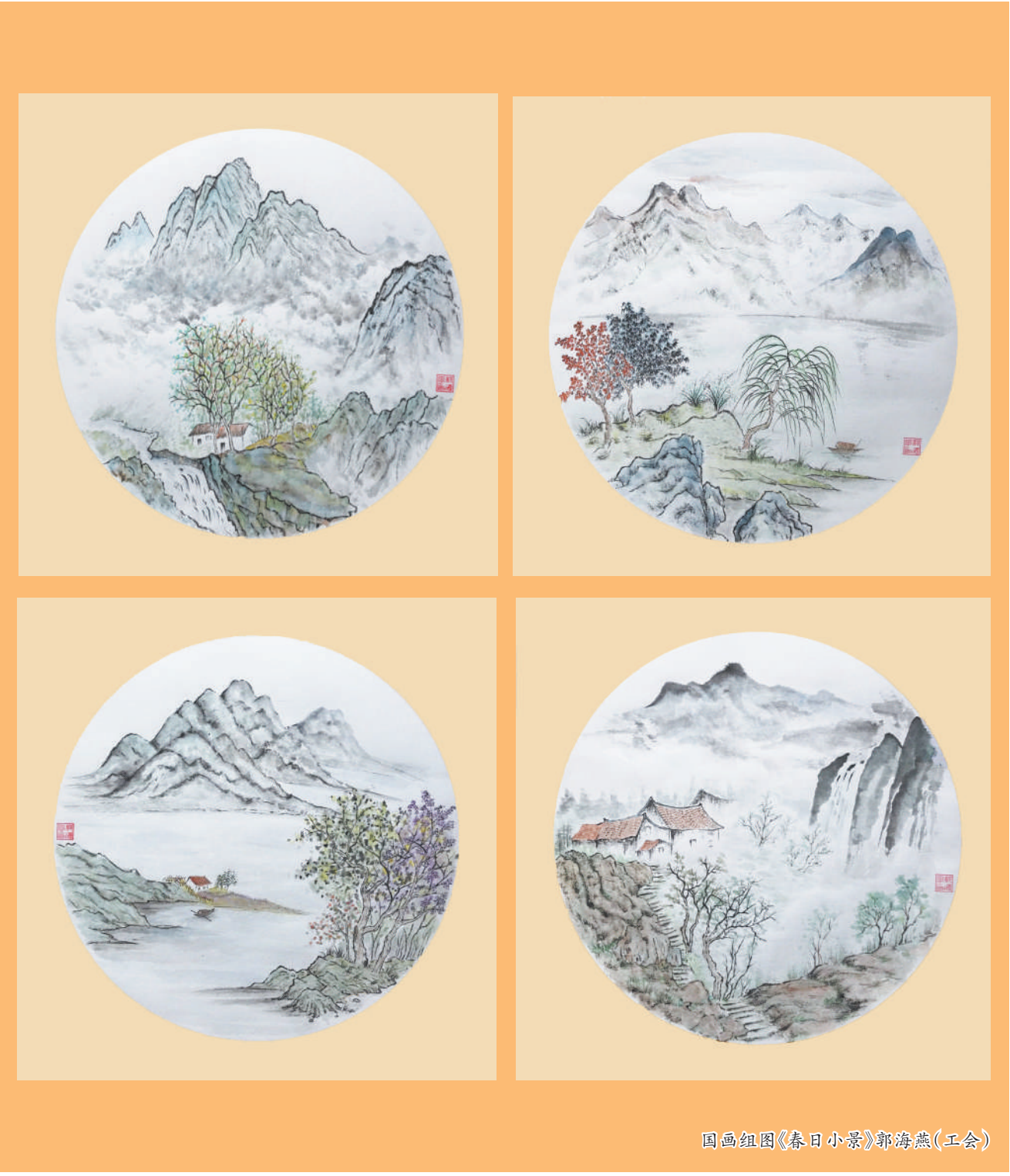
国画组图《春日小景》郭海燕(工会)