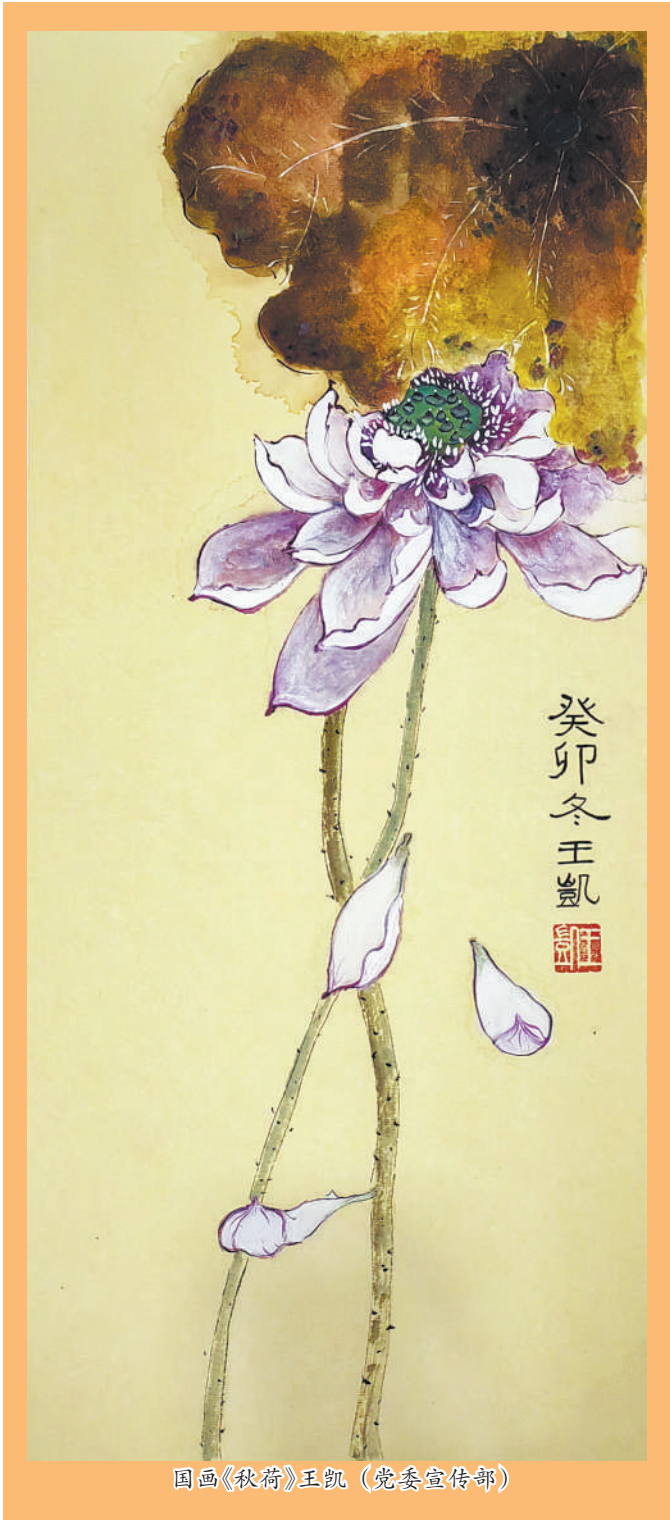
国画《秋荷》王凯 (党委宣传部)