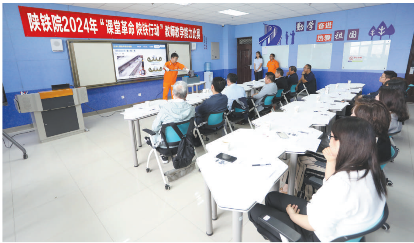
比赛现场

陕铁院讯(通讯员 卫颖)4月20日,2024年“课堂革命 陕铁行动”教师教学能力比赛现场决赛在高新校区行政楼北楼五楼开赛。学校党委书记焦胜军、校长韩小卫、副校长张学钢、刘明学现场指导。