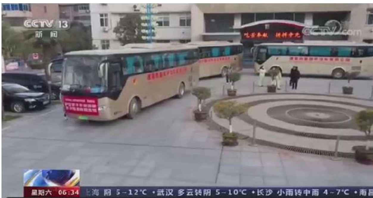
本报讯(记者 王莹)1月15日, CCTV-1综合频道新闻天下栏目、CCTV-13新闻频道新闻直播间栏目以“陕西:铁路公路部门点对点运送

返乡大学生”为题,报道了学校点对点包车护送学子返家,确保学子顺利健康返乡的消息。此前,陕西广播电视台、西安发布、渭南电视台、