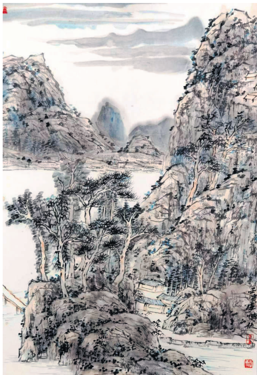
山林渔家图 李博(党政办)

为人间的守护者继续以大爱护佑稻禾。但无论如何,我总是怀着这样一种坚定的信念,我相信袁隆平爷爷并没有离开我们,他只是化作了天上的一颗耀眼的星星,还在慈爱地看着我们青少年茁壮成长,还在殷切地盼望中国杂交水稻培育愈来愈好,还在用自己的最后一份力量为这山河盛世添砖加瓦。 九十载的人间起伏,您来时满目疮痍,您走时锦绣河山,可是您还是在牵挂着的吧,牵挂着中国百姓都要牢牢掌握自己的饭碗,心系着祖国粮食安全的筑防,你把殷切的期许放在了我们的身上,自己却先睡去了。 爷爷,我时常会想,这真是一个流行离开的时代,但恰巧的是,我们都不擅长告别。但我知道,想念是拥有的另一种方式,所以我会时常想念您,乘着您的光芒,保持滚烫的热忱,继续笃定前行。 永远无法忘记,全中国最好的爷爷。