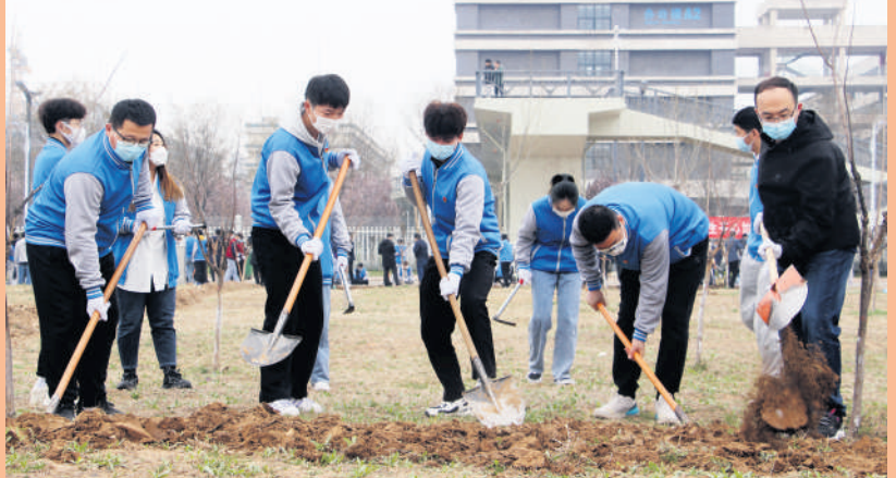
春回大地,万物复苏,在这个充满生机的季节,3月20日上午,学校组织高新校区的部分师生代表在高新校区西区开展了主题为“师生齐心协力,共建绿色校园”的劳动教育实践活动。