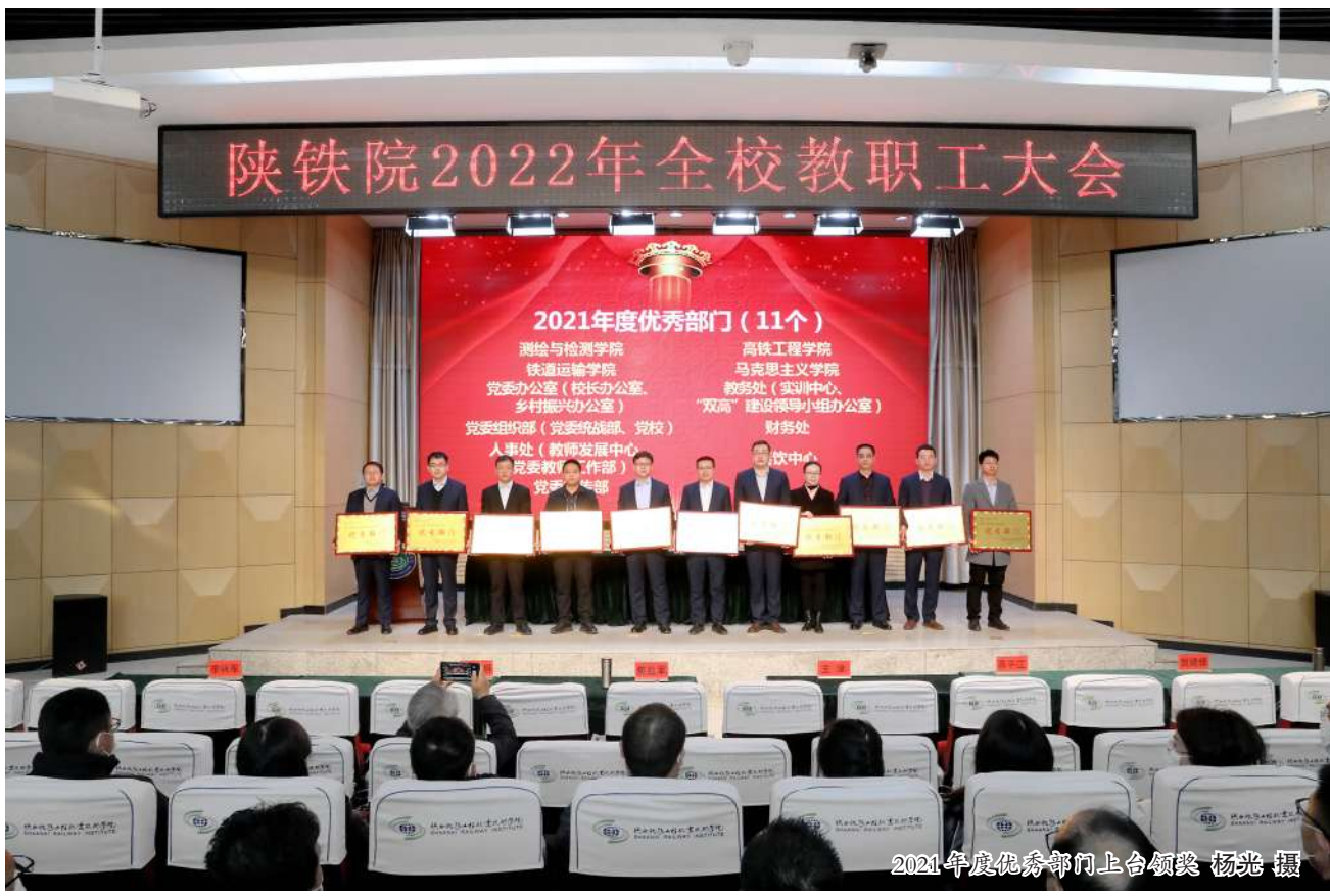
2021年度优秀部门上台领奖

本报讯(通讯员 周荣亚 记者 王莹)2月28日,学校在新校区召开2022年教职工大会。会议由党委副书记李林军主持。会议总结了学校2021年工作,安排了学校2022年工作,并表彰了一批先进集体和个人。 会上,副校长蒋平江宣读了2021年度考核优秀部门、优秀科室、优秀个人、优秀教师、先进工作者表彰决定;2021年度校外荣誉表彰部门和个人;2021年度师德师风标兵、师德先进、最美教师表彰决定;2021年度文明院部、文明处室、文明教研室表彰