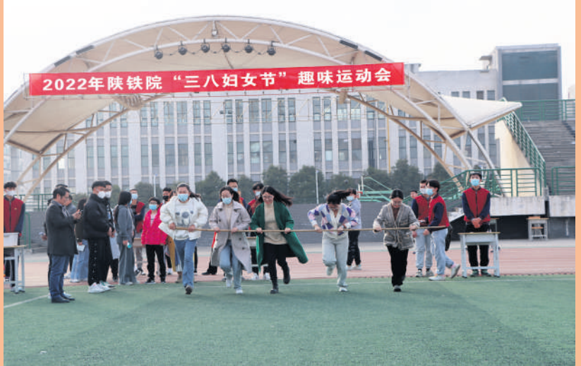
迟日江山丽,春风花草香。为庆祝第112个“三八”国际劳动妇女节,团结动员学校女教职工听党话、跟党走,激发广大女教职工投身学校发展,建功“十四五”,踔厉奋发迎接党的二十大热情,3月3日下午,学校在临渭、高新两校区分别开展女教职工“巾帼志——我们的新征程”暨庆祝“三八”国际劳动妇女节趣味活动。