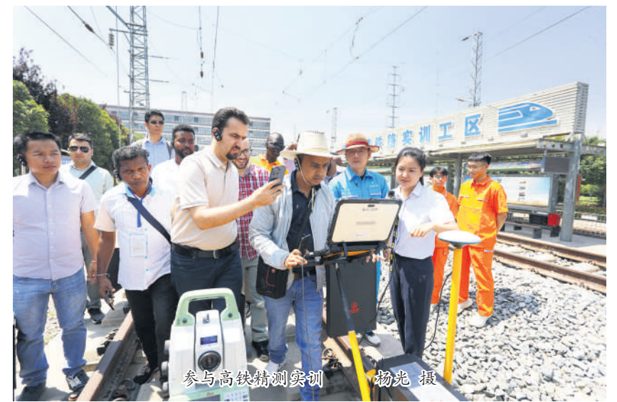
参与高铁精测实训

陕铁院讯(通讯员 郝付军)6月14日,由商务部主办、西南交通大学与商务部国际商务官员研修学院联合承办的“轨道交通建设与运营管理研修班”走进学校交流、考察。“一带一路”职教联盟常务副理事长孙建宁,西南交通大学网络教育学院党总支副书记马琼,学校党委书记焦胜军、副校长张学钢、学术委员会常务副主任王闯,党政办、教务处、国合处及二级学院副主任参加座谈会。来自非洲加纳、毛里求斯、埃塞俄比亚、亚洲越南、老挝、约旦、伊拉克、尼泊尔、斯里兰卡等9个国家33名轨道交通领域官员出席。