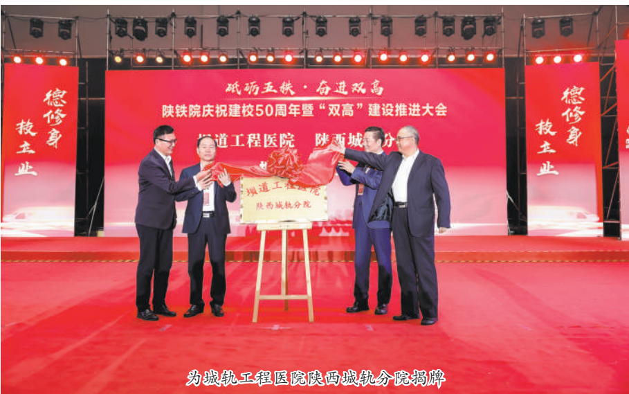
为城轨工程医院陕西城轨分院揭牌

陕西铁路工程职业技术学院(通讯员 郭军)11月5日,以学校建校50周年校庆典礼为契机,学校邀请中国工程院院士、坝道工程医院院长王复明抵渭,连同中铁一局、中铁二十局等企业,举行坝道工程医院陕西城轨分院揭牌仪式。