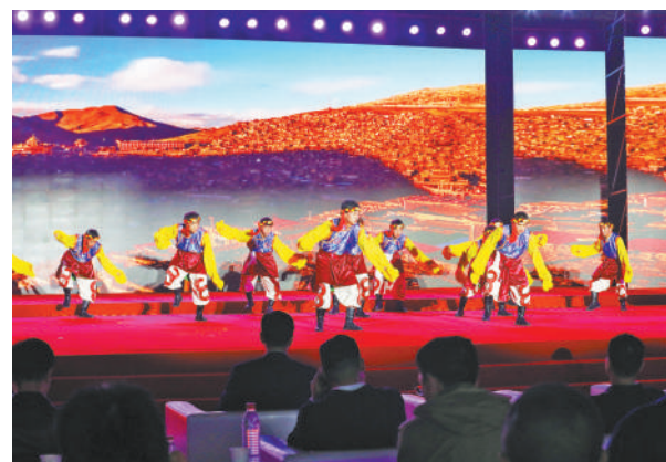
11月4日晚,学校庆祝建校50周年文艺晚会在新校区文体中心华美绽放。2800人现场观看了演出,历届校友及学生家长通过网络直播共享盛会。晚会分为因铁而生·守初心、铁路花开·铸锦绣、铁军筑梦·育英才、铁色长虹·向未来4个篇章,将一幅讲述学校发展历程的宏伟画卷徐徐展开,带领观众重温了一段段感人至深的奋进故事,回忆了一个个激动人心的高光时刻。