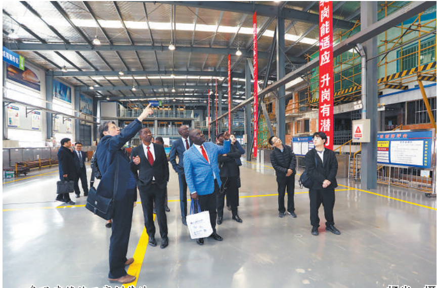
参观建筑施工实训基地