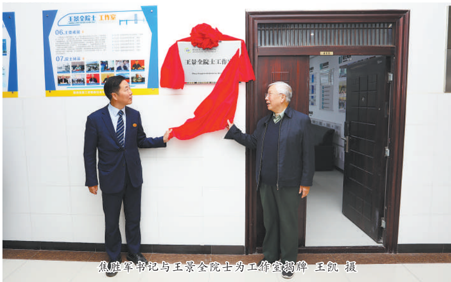
焦胜军书记与王景全院士为工作室揭牌

陕西铁路工程职业技术学院(通讯员 章韵)11月6日下午,学校“王景全院士工作室”揭牌成立。中国工程院院士、中国人民解放军陆军工程大学教授、博士生导师、少将王景全和学校党委书记焦胜军共同为王景全院士工作室揭牌。铁路文化研究中心主任车绪武、人事处处长刘超群、高铁工程学院副院长朱永伟以及20余名骨干教师参加了揭牌仪式,仪式由高铁工程学院院长赵东主持。